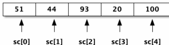
Figure 2: 陣列儲存值 (value) 與 index 的關係

如上所示，宣告一陣列 sc，每個 int 並列儲存於陣列中，以 index 值 (0~4) 做為存取依據，因為 index 值為連續整數，所以我們可以很方便的套用 for-loop 來存取陣列內容，例如：